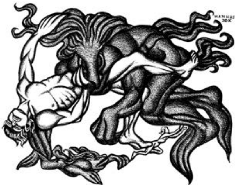
Hannes Bok (pseud. för Wayne Francis Woodard, 1914-64) var en av mycket få illustratörer under pulperan som hade konstnärstatus. Här hans illustration till Leigh Bracketts ”Water Pirate” i Super Science Stories , januari 1941.

Vidare är hennes prosa fångslande och jag är verkligen inte frestad att analysera huruvida det handlar om det ena eller det andra när jag läser henne. När hon hade i uppdrag att förvandla andra författares historier till filmmanus, var hon omedelbart beredd att anpassa sina egna attityder till de andra författarnas (eller Howard Hawks) speciella uttrycksformer, men hon bidrog alltid med den där Brackett-känslan till arbetsuppgiften. Hon visste vad hon gjorde och besatt en omedelbar förmåga att visualisera scener och skapa oöverträffade dialoger, repliker och enradingar.