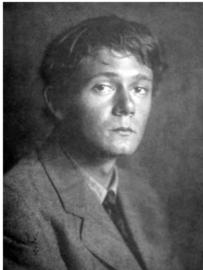
Pojkgeniet Clark Ashton Smith 1912.

Smith började tidigt skriva. Hans allra första alster, tillkomna när han var 11, var sagor och imitationer av Tusen och en natt . När han var 14 skrev han sitt allra längsta verk, kortromanen The Black Diamonds , som är en äventyrsberättelse i Tusen och en natt -miljö. Denna förblev opublicerad fram till 2002; men den följdes av ytterligare äventyrsnoveller i orientalisk miljö, inspirerade av Rudyard Kiplings noveller om Indien, och flera av dessa publicerades profession-